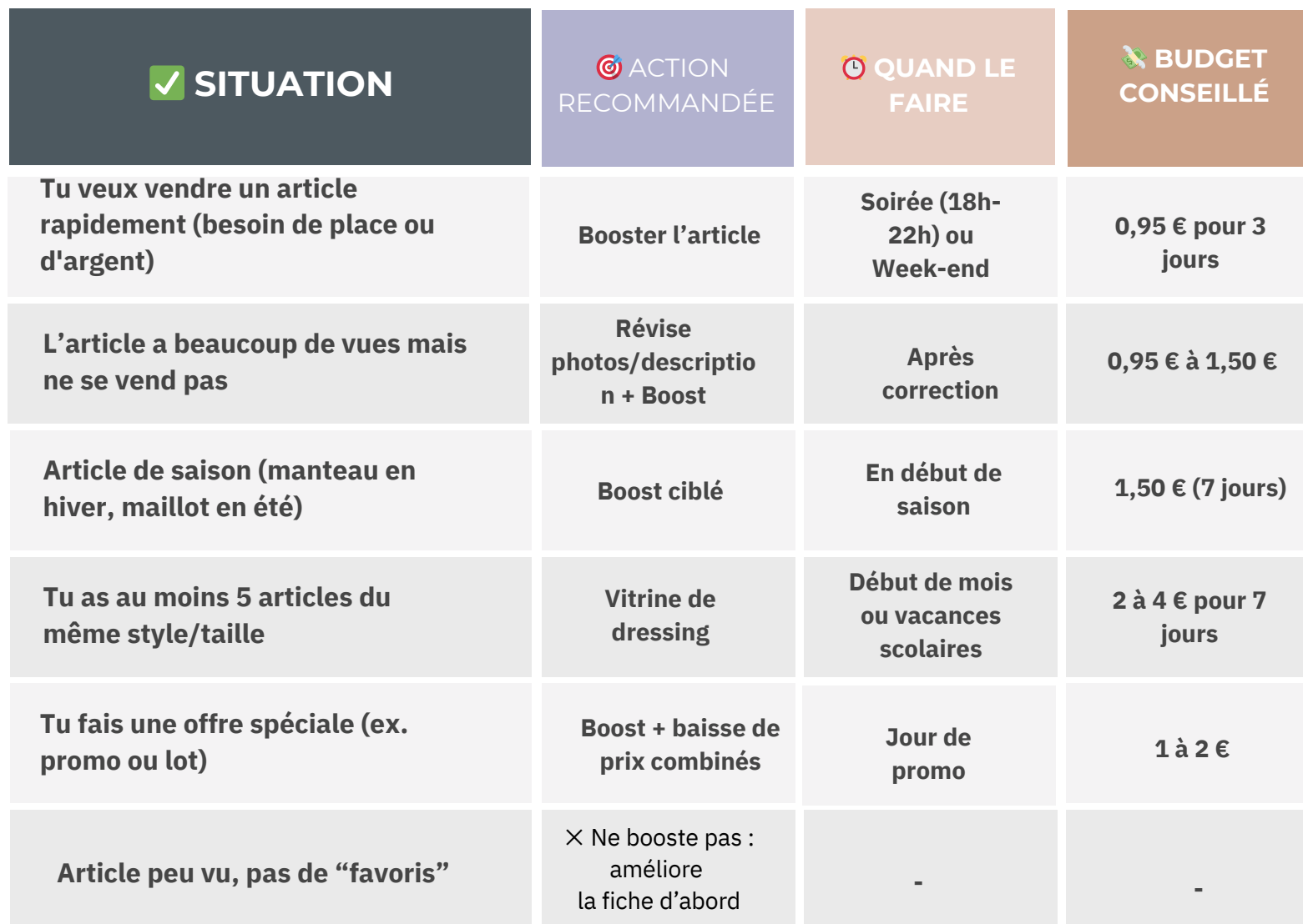
TABLEAU STRATÉGIQUE : BOOSTER OU METTRE EN VITRINE ? – VINTED